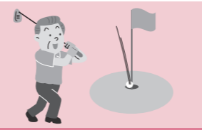
ホールインワン祝賀会を開催した。

ホールインワンまたはアルバトロス を達成したとき、それを記念してのパーティー開催や、記念品の贈呈等にかかる 費用 をお支払いします。