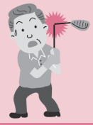
ゴルフプレー中に木にぶつけてクラブが折れた。

日本国内外 を問わず、住宅外において携行している被保険者所有の 家財 が 偶然な事故で損傷 した場合が対象となります。