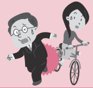
自転車走行中に他人に当たり誤ってケガをさせてしまった。

日本国内外 を問わず、日常生活における法律上の 損害賠償事故 が対象となります。